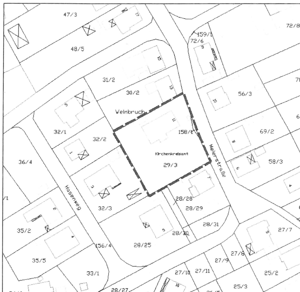
Abb. 2: Geltungsbereich des Bebauungsplanes Nr. 8 "Meierstraße", 3. Änderung