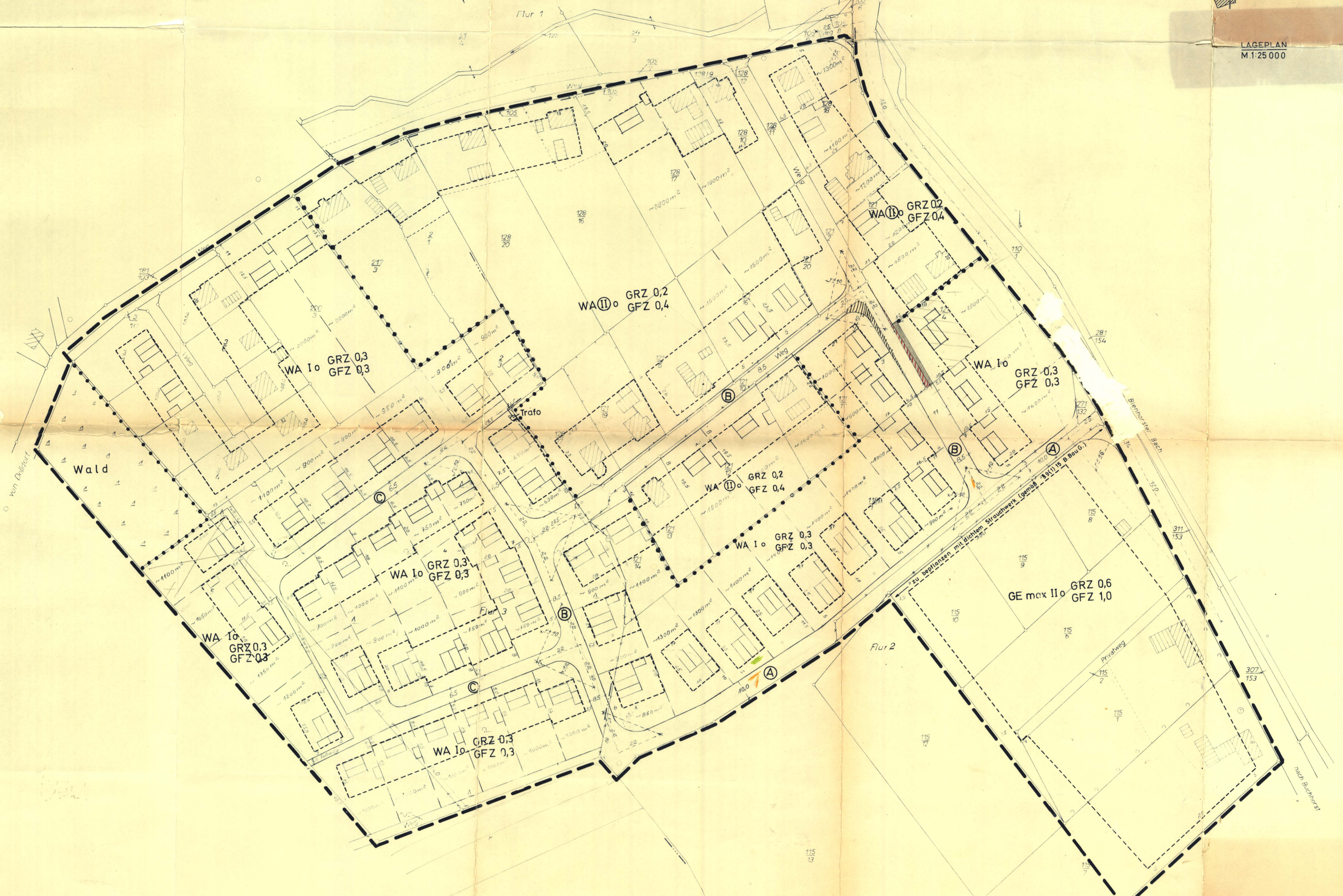
LAGEPLAN M 1:25 000