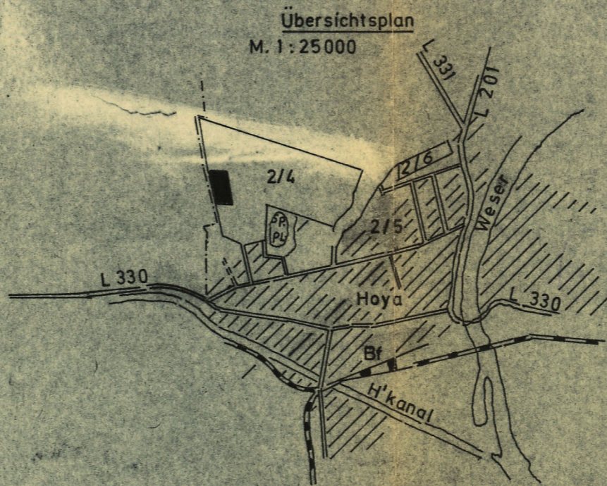
Übersichtsplan M. 1:25000